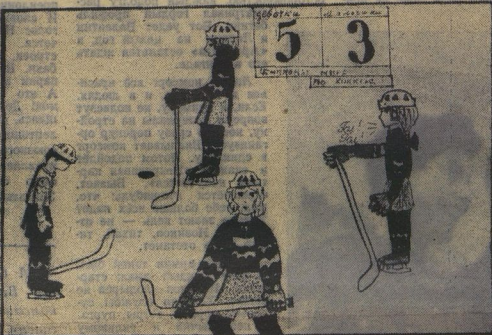
Рисунок КАТИ БЕЛГОРОДСКОЙ из Челябинска подводит итог матча «челюбината» мира среди девочек и мальчишек.

Год издания 49-й № 28 (5743) * Пятница, 6 апреля 1973 г. * Цена 1 коп.