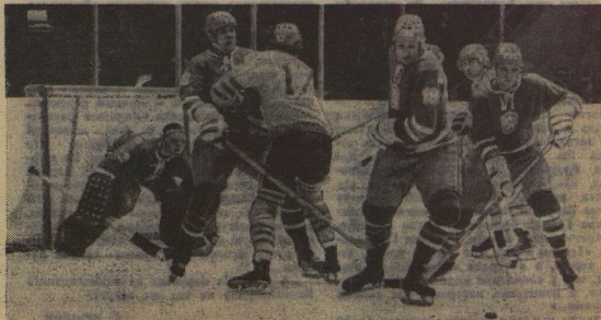
играют сборные Швеции и СССР.