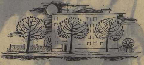
Рис. Я. КАЛАМОНОВ.

Маленькая городская булочка с надкусанным концом лежала на столе.